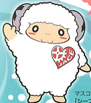
マスコットキャラクター 「シープリン」

臨床工学技士は 通称CE (Clinical Engineer) と 呼ばれています。 当会では6月2日を “CEの日”と制定しています。